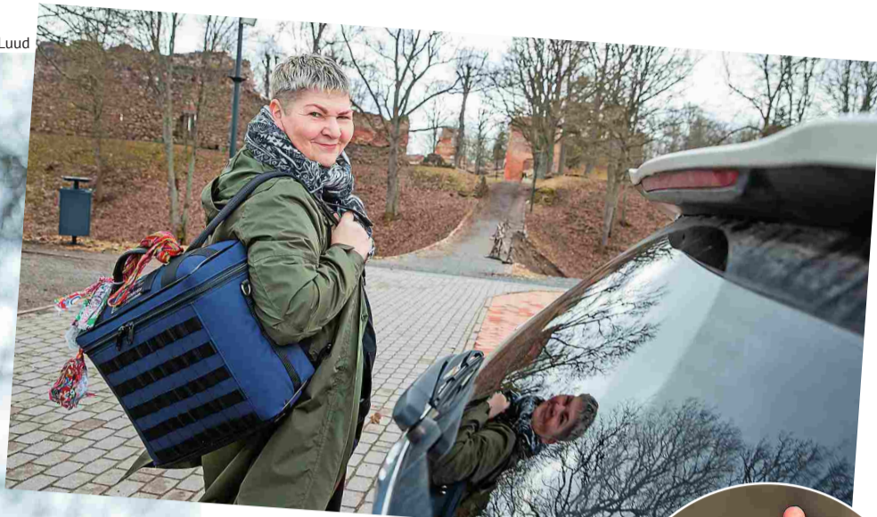
Piret on alalõpmata lennus: kord Tartus, kord Viljandis, siis Tallinnas, tagatipuks Helsingis – ja siis jälle otsast peale.