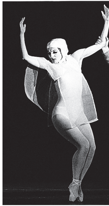
1971. Suryin balletis «Joanna tentat

nutan... Vaadake, mul on kodu üks terve tuba kaste täis, ei mahu liikumagi – ligemale 40 võib neid kokku tulla, lisaks kohvrid –, see on terve mälestuste maailm, ükskõik, mida sa seal siis parasjagu ei võtaks. Kui ma selle intervjuuga seoses üritasin seal midagi välja urgitseda, nii igaks juhuks, leidsin vaid paar asja ja võin nüüd ainult sellest rääkida kolm päeva. Aga ma ju tapan ainult teie aega. Tõmmake pidurit, kui vaja!