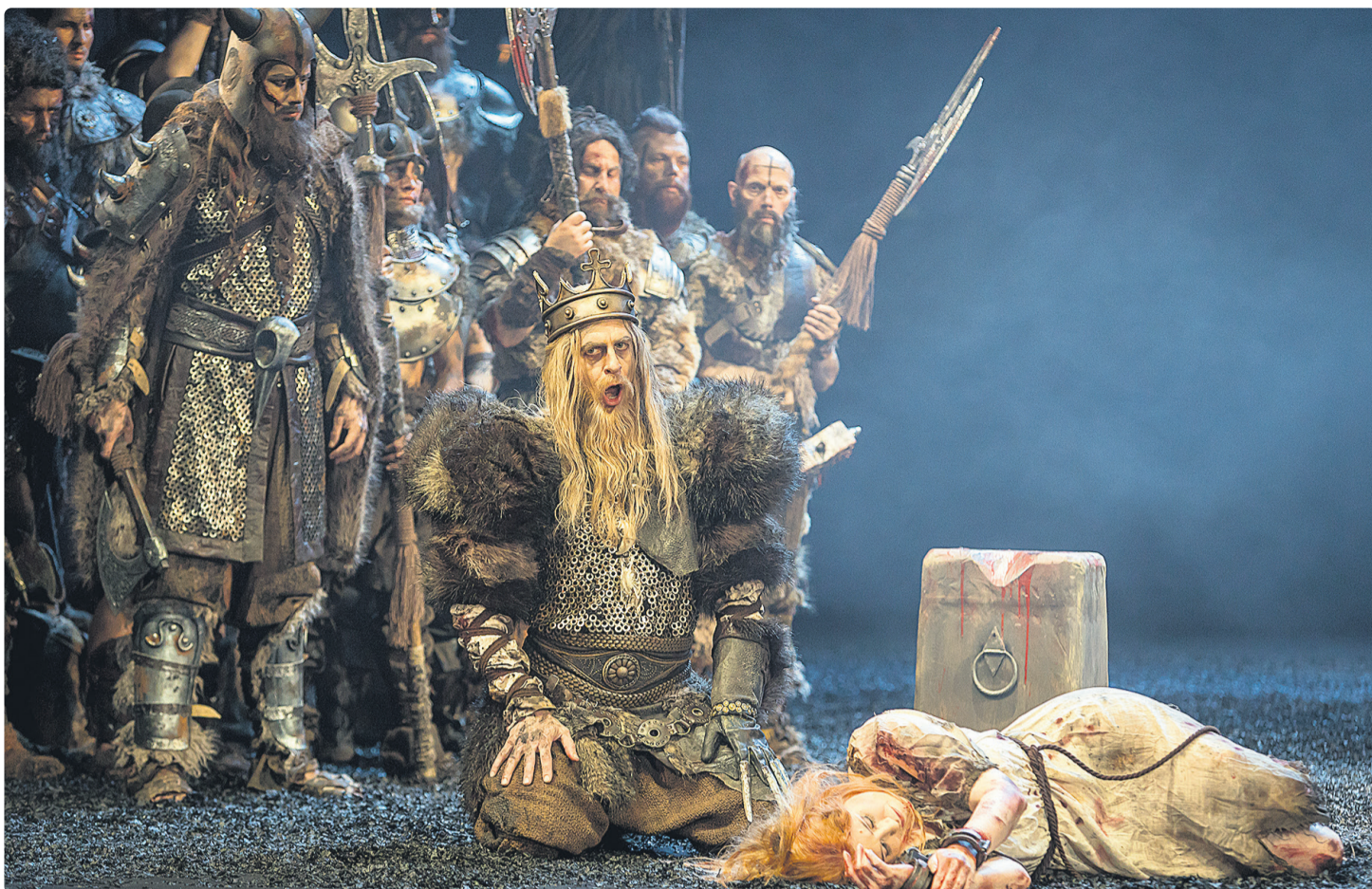
Richard Wagneri «Lohengrin» Estonias: Mis võiks olla veel üllam, kui mõök käes oma armastatu eest võidelda?