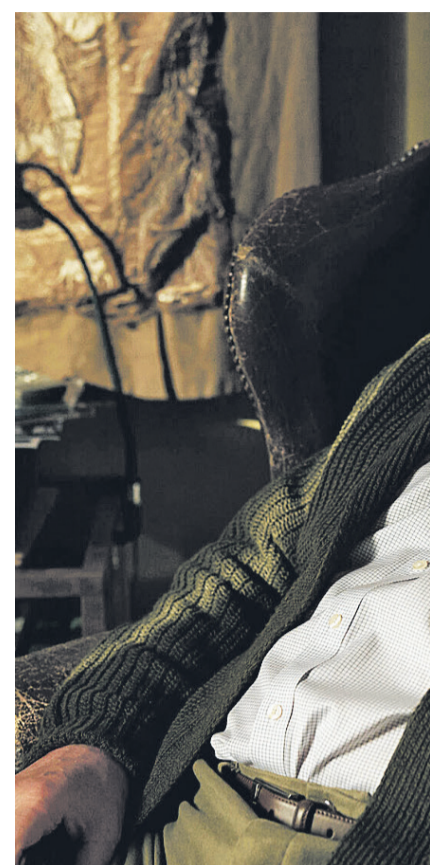
Parim näitleja Anthony Hopkins filmis «Lood loevad» stsenaariumi eest.

asuvad vagunelamusse, triivides mööda kontinenti nagu tuulest aetud prügi. Nagu ütleb McDormandi tegelane Fern: ta pole mitte «kodutu», vaid «majatu». Suure osa filmist teebki