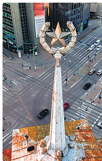
Punatäht Liivalaia ristmikul, Tartu maantee 24.

Kultuuriminister tõi esile, et eelnõu puhul puudutab keeld ja ehitise eemaldamise nõue teiste hulgas ka kalmistutel asuvaid objekte. «Seni on ühiskond nende olemasolu teatud määral aktsepteerinud. Kalmistu on avalik koht ning seal asuvad nii ühiskondlike kui ka üksikisikute hauakivid, mille peal võivad olla samuti n-ö keelatud sümbolid. Samuti ei ole välistatud ebamõistlikud ja ebavajalikud vaidlused muudele minevikusündmustele hinnangute andmisel, olgu selleks näiteks küsimus, kas mõõgavendade ordu vapp või holokausti monument seostub genotsiidiga või mitte,» ütles Hartman.