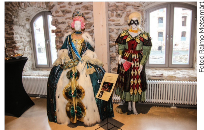
Kostüüme saab näha kahel korral.

1. märtsil algas teatrikuu. Sel puhul on Põltsamaa lossi väravahoones võimalik näha värvikat näitust, mis kannab nime „Rahvusoper Estonia ooperikostüümid“ ja kus huvilised saavad näha rõivaid ooperist „Padaemand“.