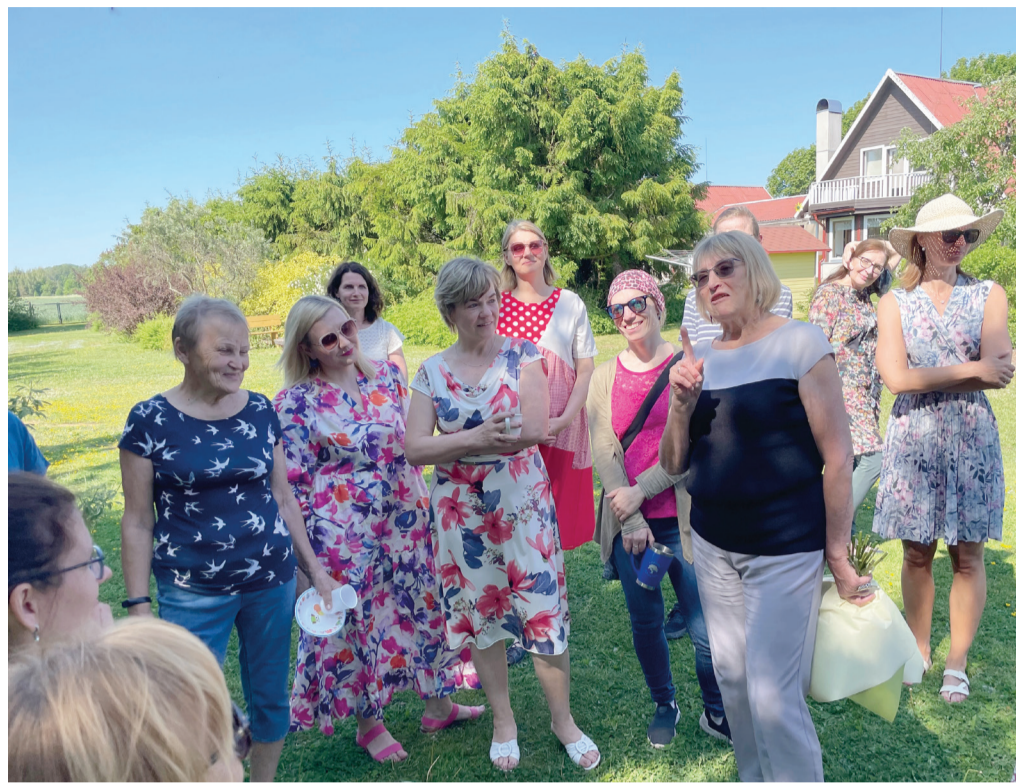
PÜGi õpetajate kooliaasta lõpupiknikul 2023 uudistati ka Heli koduaias.

Kas õpetajaamet on iga päev eriline ja omanäoline? „On tõesti, õpilased