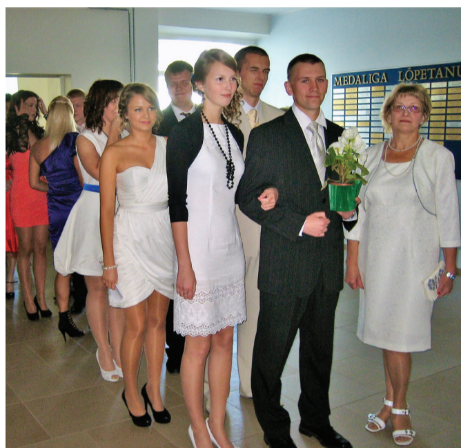
g1. lend on valmis enne lõpuaktust lillede viimiseks Vabadussõja ausamba jalamile.

Heli jaoks on kolm märksõna reisimine, aiatöö ja mingi uue asja tegemine. „Mind on kerge uute ideedega liituma meelitada. Kui tegime kaks aastat tagasi koolis valikkursuste nädala, pakkusin gümnaasistidele välja teema „Püsililled koduaias“ ja mulle tuli kursustele 9 inimest! See oli tõeliselt äge,“ tun-