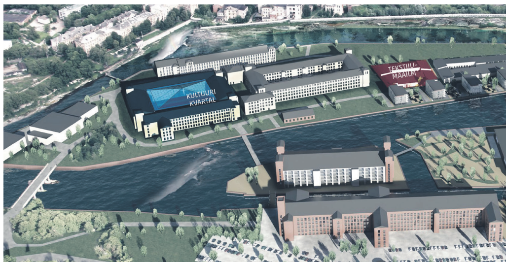
ILLUSTRATSIOON NARVA GATE OÜ

NARVA KREENHOLMI KULTUURIKVARTAL MANUFAKTUUR: Multifunktsionaalne kultuurikeskkond Kreenholmi saarel. Kultuurkapitali finantseeringut küsitakse vana ketrusvabriku 2. ja 3. korruse ruumide lihtsakuuliseks renoveerimiseks.