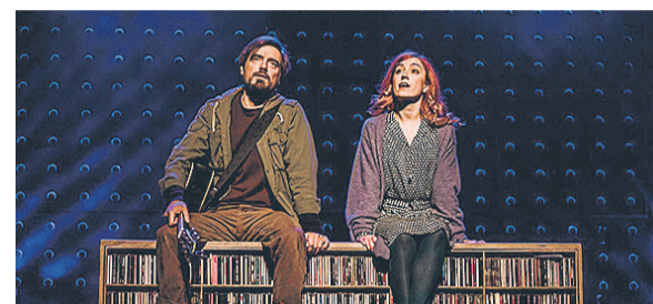
Ugala muusikalisele armastusloole «Once» elas kaasa 19 371 vaatajat.