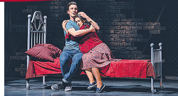
Estonia muusikalavastus «West Side Story» oli 2019 publikuarvu edetabelis kolmandal kohal.