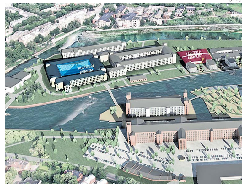
Narva Kreenholmi kultuurikvartal Manufaktuur.