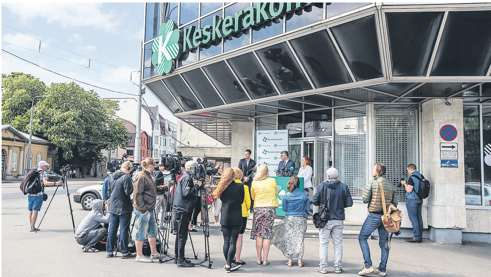
Keskerakond andis eile püstitajal-pressikonverentsi oma peakorteri ees Tallinnas Narva maanteel.