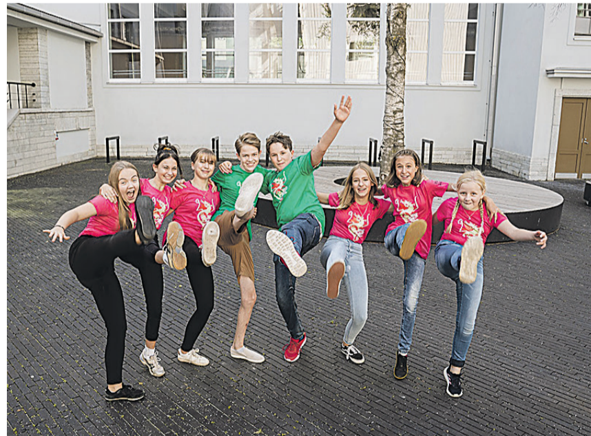
Laste ja noorte muusikafestivali „Big Bang Tallinn 2021“ saadikud.

Üks kontsertlavastus – „3ACH“ viib muusikaajaloo suurkuju Bach'i maailma. Teises – „Nomad: une üksed“ –