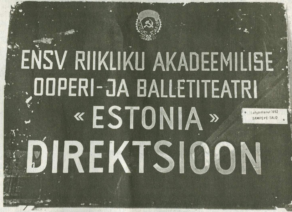
Eesti nõukogude minevikku meenutav silt jõudis eile läbi mitme mehe uuesti rahvusoper Estonia juhtkonnani.