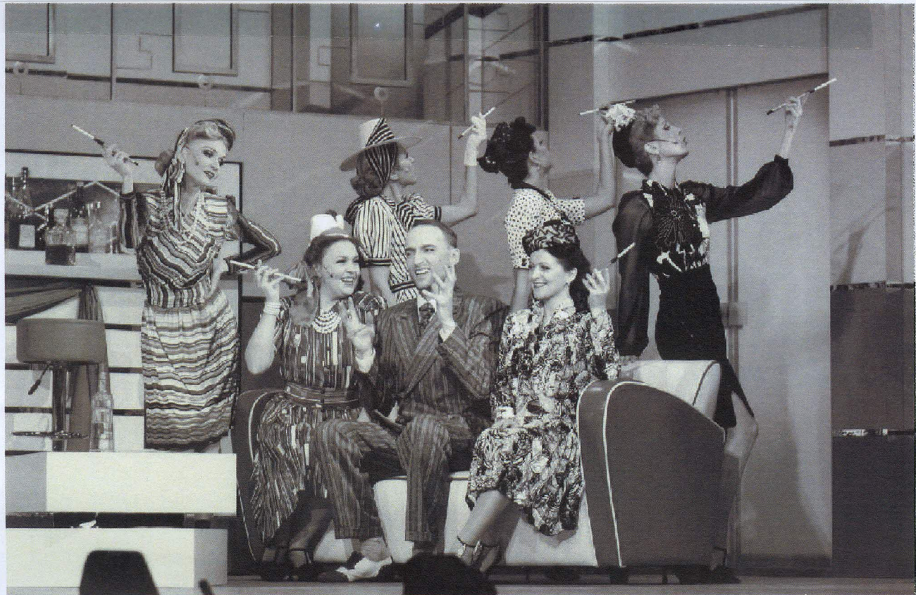
Märt Avandi mängib "Savoy ballis" türklast – liiderdajat Mustafad.