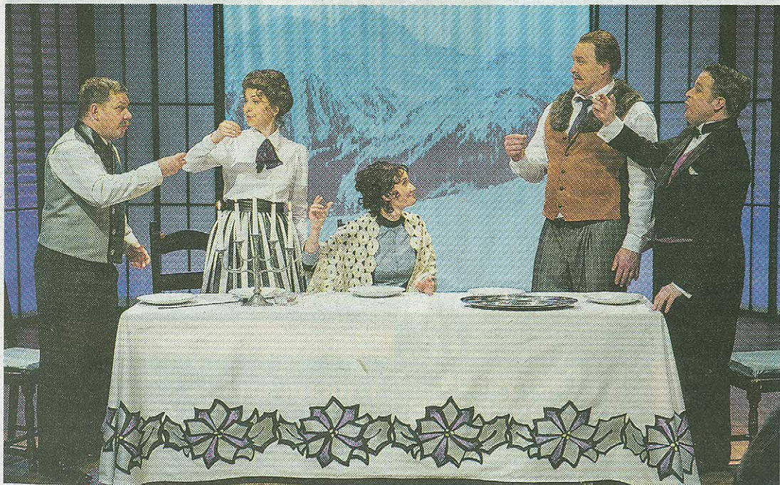
Два поколения семьи Байярд за праздничным столом: отец семейства Родерик (Рауно Эльп), его дочь Женевьева (Теэле Йыкс), его жена Люси (Янне Шевченко), нузен Брэндон (Март Лаур) и сын Чарльз (Оливер Куузик) пьют воображаемое вино из воображаемых бокалов.