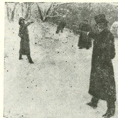
Duell. Ilja Repini joonistus 1899. a. Puškini «Evgeni Onegi- ni» väljaandele.

Kaks vihameest! Kas tõesti praegu ei mäleta siis kumbki neist nii hiljutisi armsaid aegu, kus mõisteti veel teineteist? /.../ ... Jah, veel on mahti, et kargel hommikul need kaks kätt andes naerma pahvataks! /.../ Onegin tulistas. Ning samas löi Lenskile ta kalmukell.