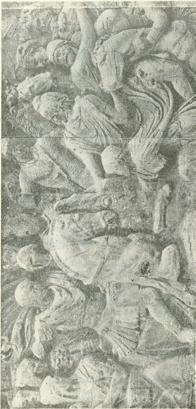
VOITLUS ROOMLASTE JA BARBARITE VAHEL. Bareljeef.